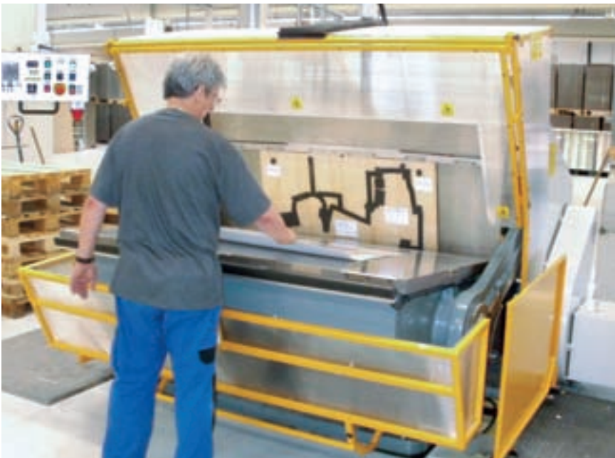
Kongsberg-Plotter (oben) und Rabolini-Stanztiegel (unten)